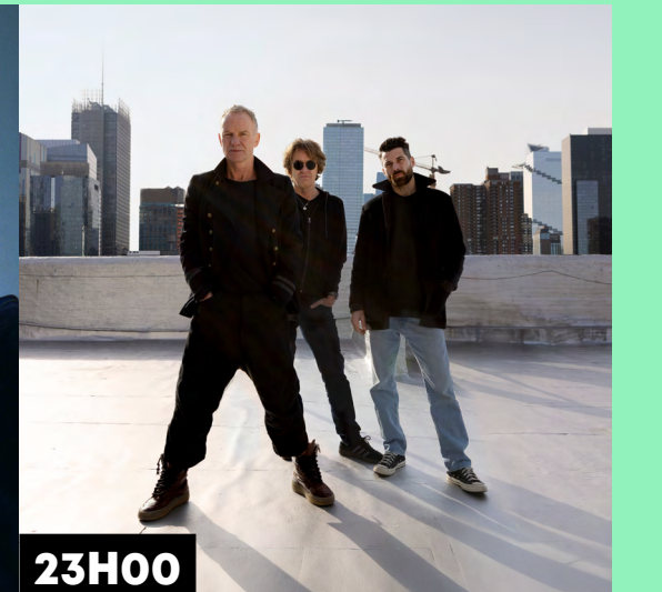
GOTTS STREET PARK